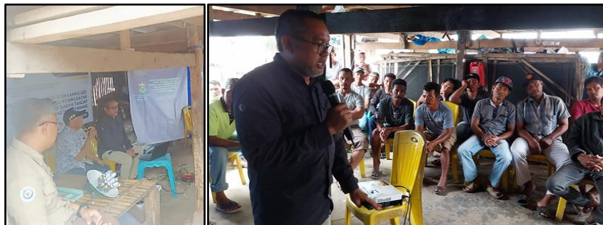
Gambar 4. Penyampaian materi penyuluhan oleh Narasumber

Kegiatan penyuluhan disampaikan dengan materi tentang pemanfaatan cahaya lampu sebagai alat bantu penangkapan ikan pada bagan tancap (Gambar 4).