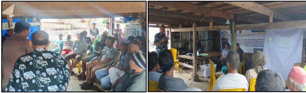
Gambar 3. Suasana diskusi pada penyuluhan teknologi lampu pengumpul ikan

Peserta yang mengikuti kegiatan pengabdian sangat serius dan bersemangat mengikuti materi yang disampaikan oleh tim pengabdian. Pemanfaatan lampu sebagai alat bantu pengumpul ikan telah berkembang pesat sejak ditemukan lampu listrik. Sebagian nelayan memiliki pemahaman bahwa semakin besar intensitas cahaya listrik yang digunakan akan memberikan hasil tangkapan yang banyak juga. Hal ini tidak sejalan dengan penelitian Wiyono (2006), bahwa ikan mempunyai respon terhadap besarnya intensitas cahaya yang berbeda-beda. Ikan memiliki batas toleransi yang berbeda-beda, sehingga pada waktu tertentu ikan akan menjauh dan mendekat sesuai batas toleransi yang dimiliki (Yami. B. 1988). Sehingga besar kecilnya intensitas otomatis memberikan efek terhadap kedatangan ikan. Hal ini menunjang keberhasilan operasi penangkapan ikan hubungannya dengan pemanfaatan tingkah laku ikan fototaksis positif. Selain itu, ikan predator memanfaatkan cahaya untuk mencari makan di area bagan dengan memanfaatkan indera penglihatan (Caosteau, F., 2003).