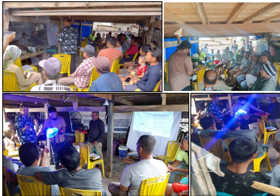
Gambar 1. Suasana pelaksanaan kegiatan penyuluhan

dapat bantuan dari Dinas Perikanan. Selain itu, umumnya mereka hanya mengetahui lampu pengumpul ikan digunakan secara konvensional yakni lampu yang diletakkan di atas permukaan air.